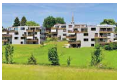
Chilenfeld, Obfelden . 2016 – 2018