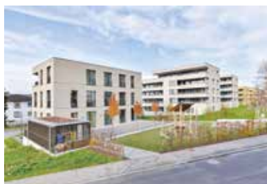
1. und 2. Etappe Blumenweg, Root 2015 – 2017