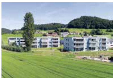
Brunnenmatte, Reiden . 2016 – 2018