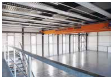
Newemag, Eschenbach . 2012 – 2013 Büroräume, Produktions- und Lagerhalle