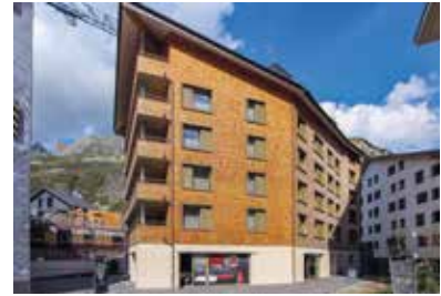
Wolf und Edelweiss, Andermatt 2016 – 2017 40 Wohneinheiten