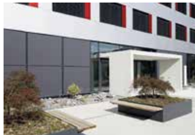
Technologie- und Trainingscenter Schindler, Ebikon . 2008 – 2009

Meeting- und Theorieräume, Räume für Simulation und Versuche