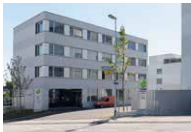
Maiengrüeni, Neuenkirch 2014 – 2016 Büroräume