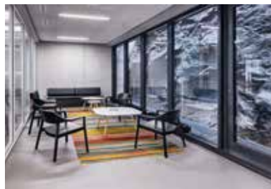
Hochschule Luzern, Abteilung für Kunst und Design, Luzern 2011 – 2012

Unterrichtsräume, Atelier, Ausstellungs- und Mehrzweckräume