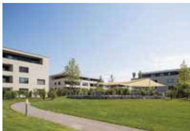
Oberfeldhöhe, Hochdorf . 2009 – 2015