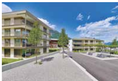
Schoried, Alpnach . 2015 – 2016